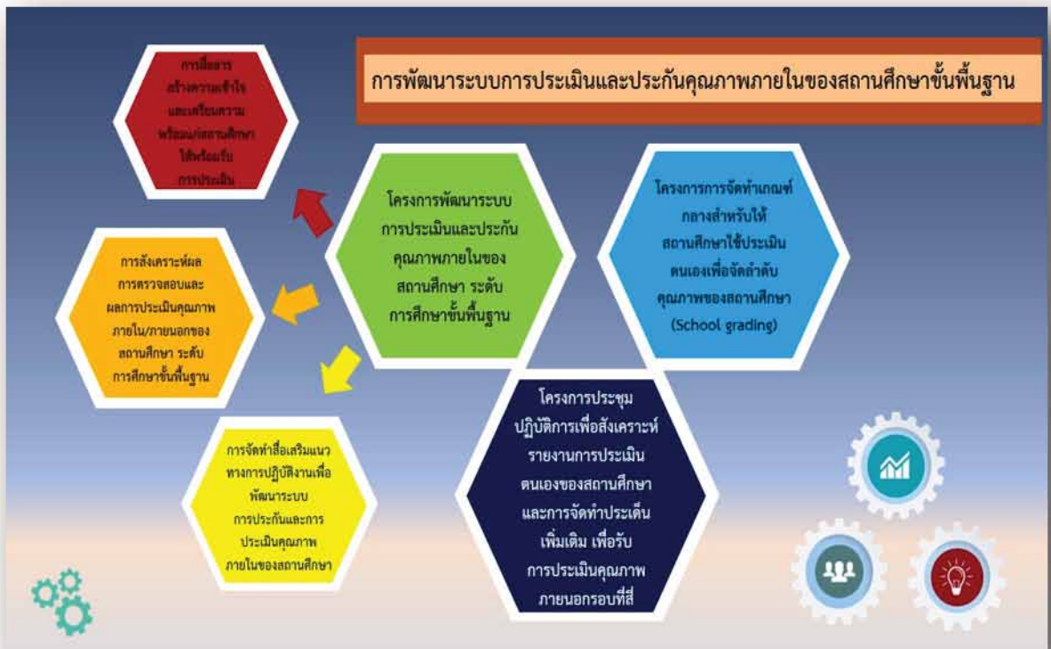
ภาพที่ 1 แผนภาพแสดงกิจกรรมที่ดำเนินการพัฒนาระบบการประเมิน และประกันคุณภาพภายในของสถานศึกษาขั้นพื้นฐาน

สำนักงานคณะกรรมการการศึกษาขั้นพื้นฐาน ได้มอบหมายให้สำนักทดสอบทางการศึกษาดำเนินการ พัฒนาระบบการประกันคุณภาพการศึกษาขั้นพื้นฐาน หน่วยงานภายใต้สำนักทดสอบทางการศึกษา เป็นผู้รับผิดชอบดำเนินการตามนโยบายดังกล่าว ทั้งนี้กลุ่มพัฒนาระบบการประกันคุณภาพการศึกษาขั้นพื้นฐาน ได้วางแผนการดำเนินการดังแผนภาพต่อไปนี้