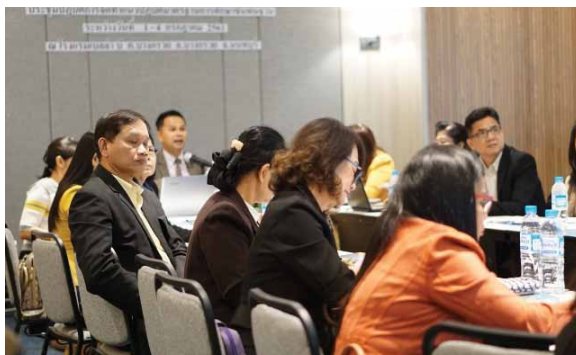
ภาพที่ 4 การจัดทำสื่อเสริมแนวทางการปฏิบัติงานเพื่อพัฒนาระบบการประกันและการประเมินคุณภาพภายในของสถานศึกษา