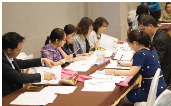
ภาพที่ 5 บรรยากาศการจัดทำเกณฑ์กลางสำหรับให้สถานศึกษาใช้ประเมินตนเอง เพื่อจัดลำดับคุณภาพของสถานศึกษา (School grading)