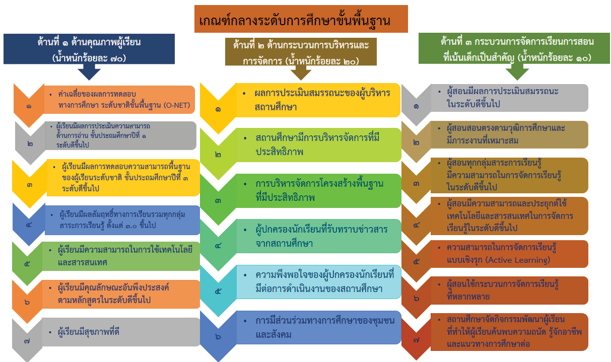
ภาพที่ 7 เกณฑ์กลางระดับการศึกษาขั้นพื้นฐาน

สถานศึกษามีเกณฑ์กลางสำหรับใช้ในการประเมินตนเองที่ได้รับการยอมรับ โดยได้รับความร่วมมือจากผู้ทรงคุณวุฒิ ศึกษานิเทศก์ ผู้บริหารสถานศึกษา และผู้รับผิดชอบงานการประกันคุณภาพการศึกษาจากหน่วยงานที่เกี่ยวข้อง ร่วมกันวิเคราะห์กรอบเกณฑ์กลางสำหรับให้สถานศึกษาใช้ประเมินตนเองและเพื่อการประเมินตามระดับคุณภาพของสถานศึกษาต่อไป