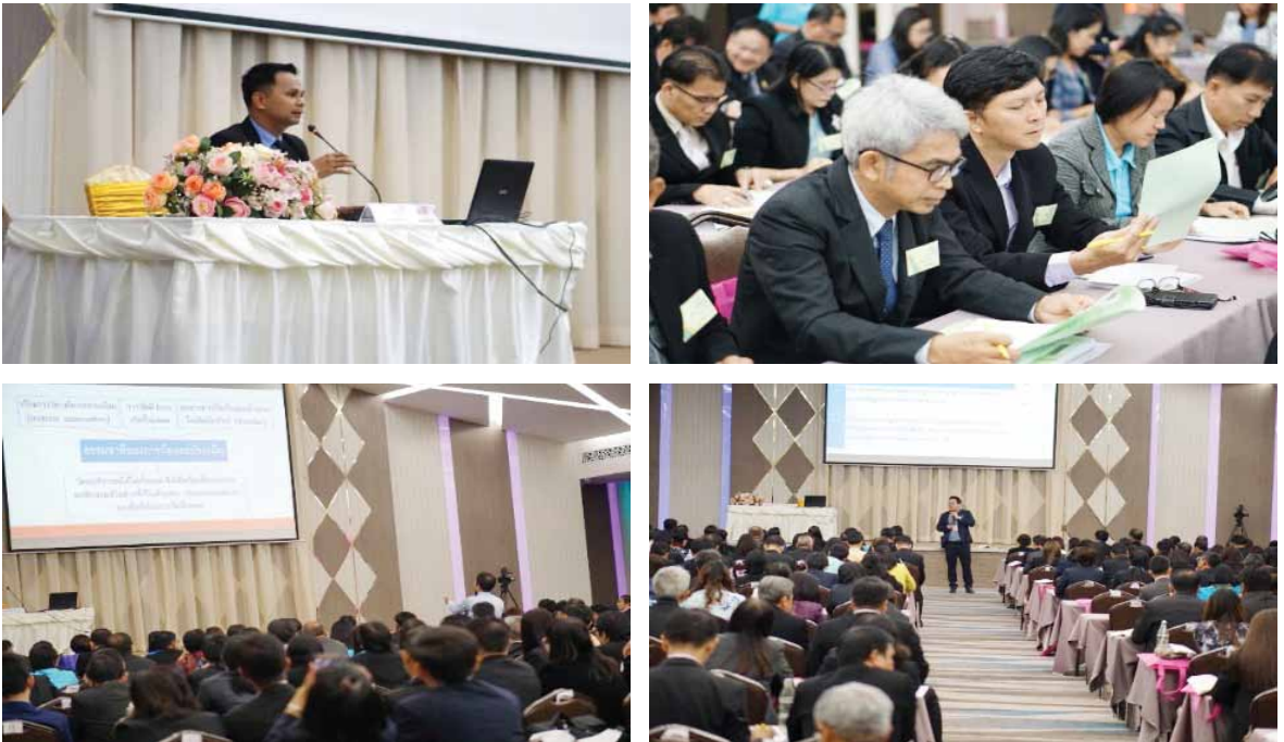
ภาพที่ 2 การประชุมสื่อสาร สร้างความเข้าใจ และเตรียมความพร้อมแก่ผู้แทนหน่วยงานต้นสังกัด และผู้บริหารสถานศึกษาให้พร้อมรับการประเมิน

เพื่อให้ผู้แทนหน่วยงานต้นสังกัดและผู้บริหารสถานศึกษาสามารถทำหน้าที่ในการร่วมเป็นคณะกรรมการประเมินได้อย่างมีประสิทธิภาพ ทั้งในเรื่องรูปแบบวิธีการประเมินแบบองค์รวม (holistic assessment) การตัดสินโดยอาศัยความเชี่ยวชาญ (expert judgment) การประเมินโดยอาศัยร่องรอยเชิงประจักษ์ (evidences based assessment) การตรวจสอบทบทวนโดยบุคคลระดับเดียวกัน (peer review) เทคนิคการสังเกต การสัมภาษณ์เชิงลึก การวิเคราะห์ร่องรอยหลักฐาน มาตรฐานการประกันคุณภาพการศึกษา และการให้ข้อมูลย้อนกลับ (feedback) แก่สถานศึกษาเพื่อนำไปสู่การปรับปรุงและพัฒนาได้อย่างมีประสิทธิภาพ