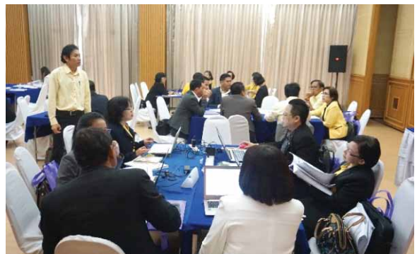
ภาพที่ 3 บรรยากาศการสังเคราะห์ผลการตรวจสอบและผลการประเมินคุณภาพภายในของสถานศึกษา ระดับการศึกษาขั้นพื้นฐาน