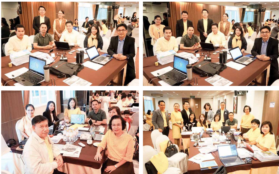
ภาพที่ 6 บรรยากาศการประชุมปฏิบัติการเพื่อสังเคราะห์รายงานการประเมินตนเองของสถานศึกษาและการจัดทำประเด็นเพิ่มเติม เพื่อรับการประเมินคุณภาพภายนอกรอบที่สี่

เพื่อเตรียมความพร้อมรับการประเมินคุณภาพภายนอกสำหรับกลุ่มโรงเรียนที่สมัครใจเข้ารับการประเมิน สำนักทดสอบทางการศึกษาจึงเห็นสมควรให้มีการสังเคราะห์รายงานการประเมินตนเองของสถานศึกษาและทำข้อเสนอแนะเพิ่มเติม เพื่อส่งให้สำนักงานรับรองมาตรฐานและประเมินคุณภาพการศึกษา (องค์การมหาชน) ต่อไป